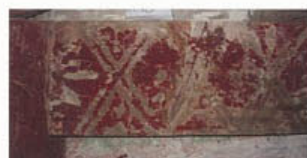
文様が残っている箇所