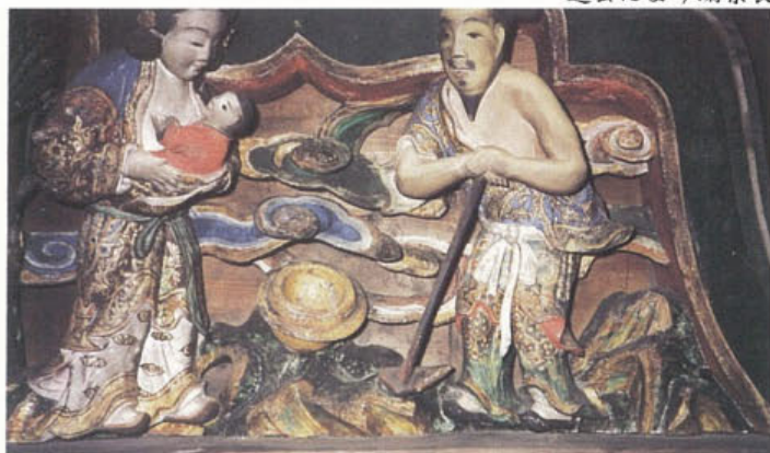
二十四孝の話のひとつ「郭巨」が題材の髹股