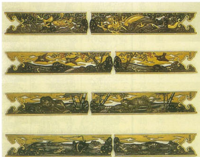
上野天神祭楼車『三明』欄縁隔金具

祭の美術工芸品は祖先の純粋な信仰心の象徴であり、その存在感が現代において私たちに感動を興させるのだと思います。 道玄だより編集部