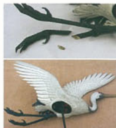
ちちぶ かわせまつり