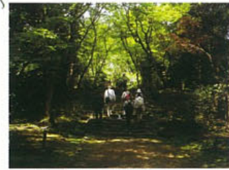
第一回 唐櫃(からと)越え講座の様子