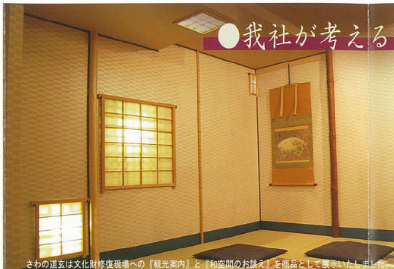
さわの道玄は文化財修復現場への『観光案内』と『和空間のお話し』を商品として展示いたしました。